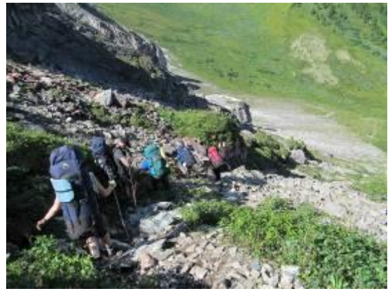
Фото 9. Спуск с пер. Аршанский.