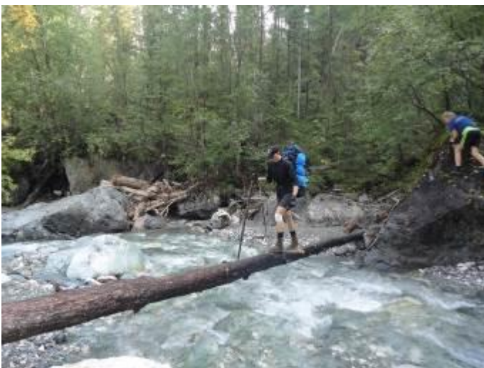
Фото 17. Переправа через р. Бобковка.