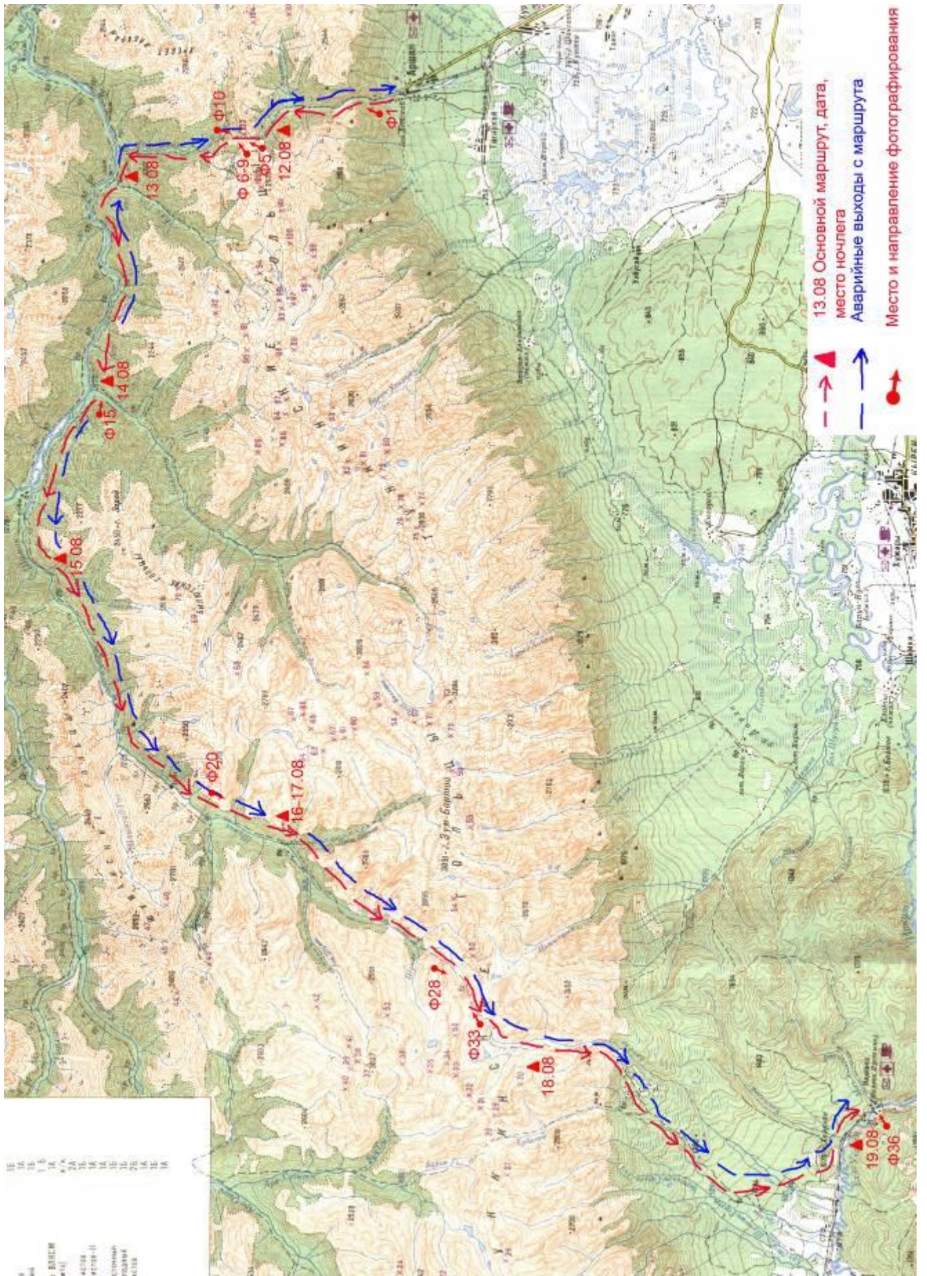
Карта района похода. М. 1: 200 000