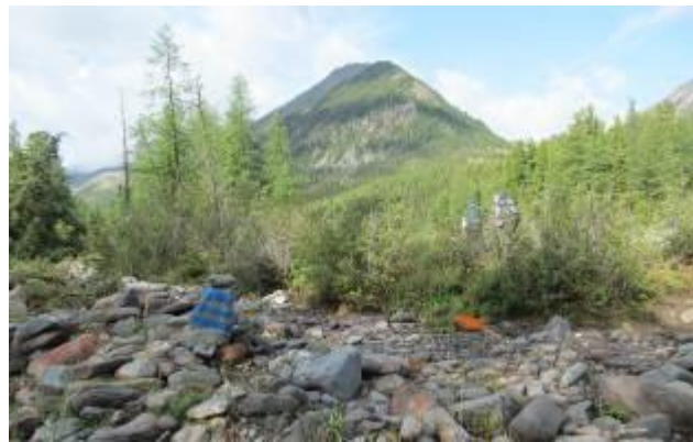
Фото 27. Маркировка тропы по правому берегу р. Шумак.