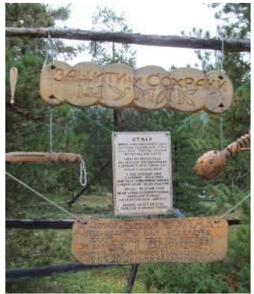
Фото 23. Посвящение Шумаку.