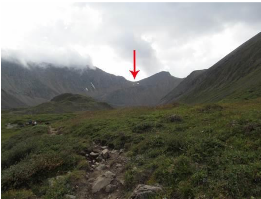
Фото 28. Вид на пер. Шумак 1А со стороны р. Шумак.