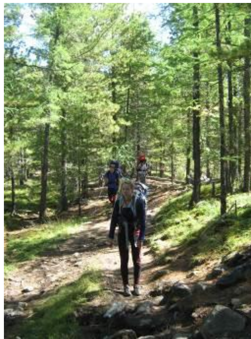
Фото 35. Тропа к курорту Нилова Пустынь.