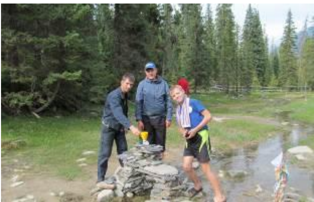
Фото 24. Минеральные источники Шумака.