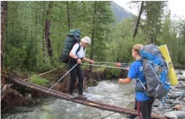
Фото 26. Мостик через р. Правый Шумак.