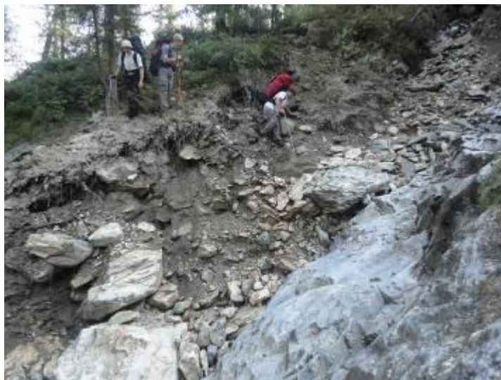
Фото 18. Тропа по берегу р. Шумак. Переход через один из ручьев.

Иногда тропа идет по прижимам по самому берегу реки (фото 19). Внизу видно ущелье, по которому течет Шумак. Затем прижимы кончаются, река течет по ровной долине, которая постепенно расширяется. По берегу реки хорошие стоянки. В 6 км от Шумацких источников расположен аншлаг и несколько священных деревьев (фото 20). Дальше идет торная тропа, через речку построен новый мостик (фото 21). Через реку Перевальную переправились по камешкам. На стоянку встали на входе на территорию источников, хотя можно было заночевать и в зимовье.