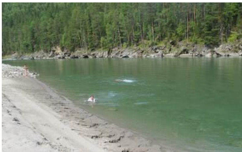
Фото 14. Р. Китой.