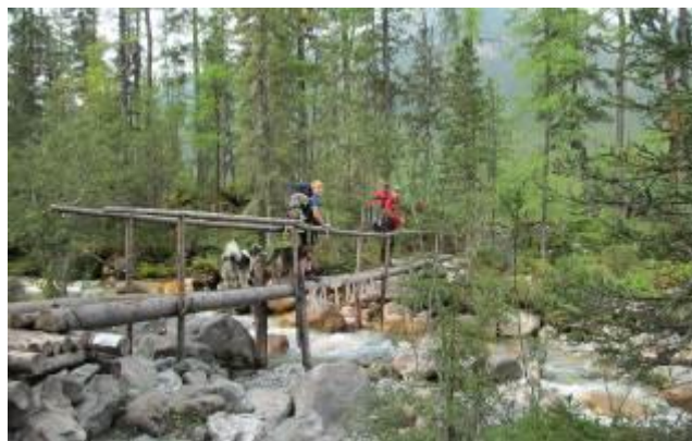
Фото 21. Мостик через р. Шумак.