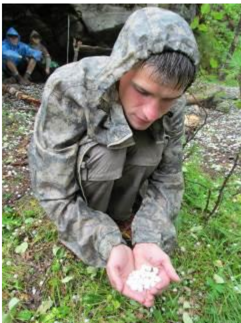
Фото 11. Устье р. Федюшкина. Град.