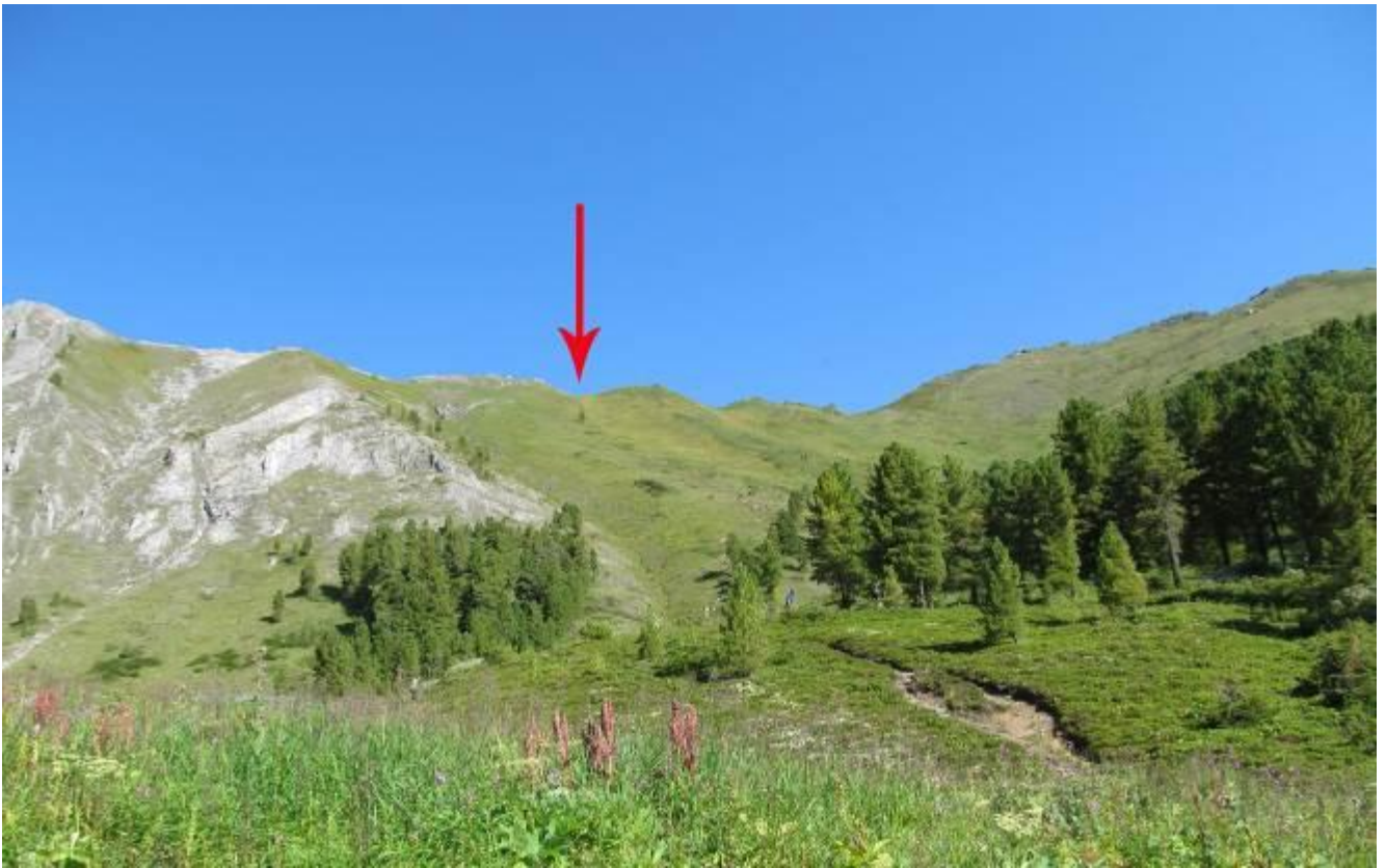
Фото 5. Вид на перевал Аршанский 1А со стороны р. Кынгарга.