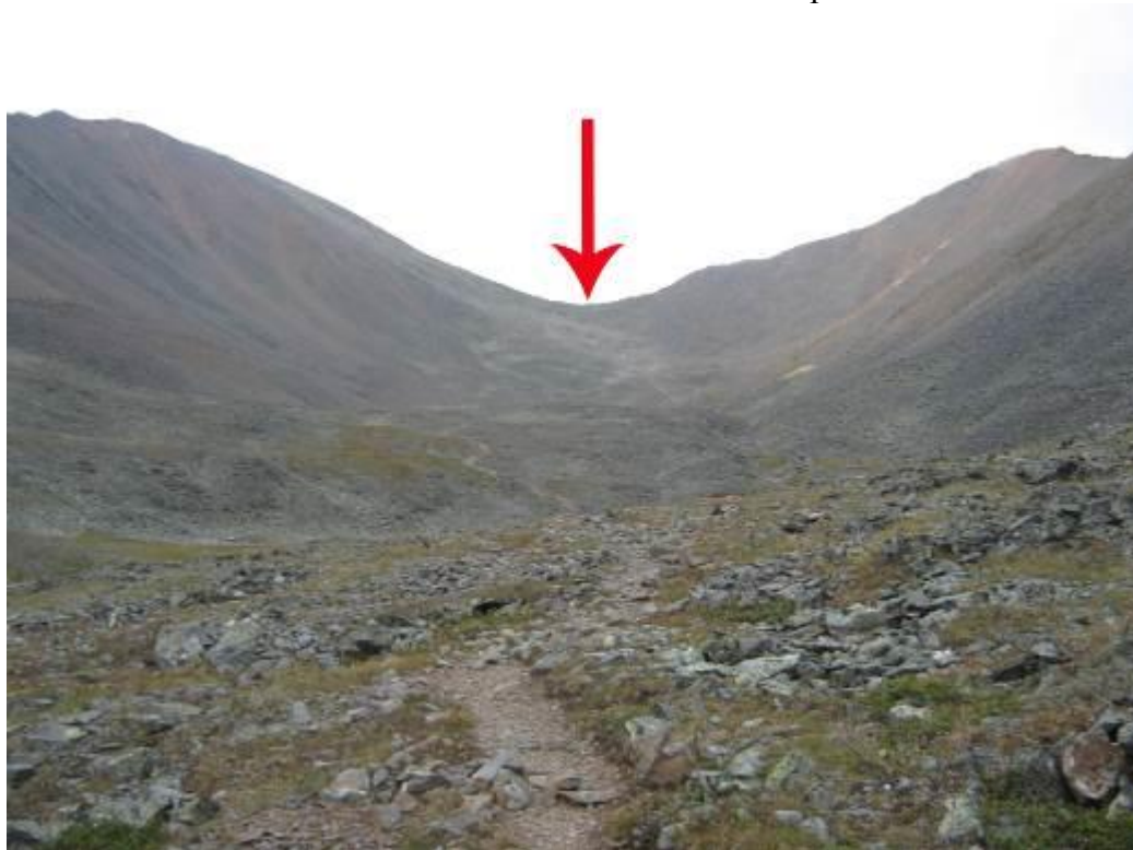
Фото 33. Вид на пер. Шумакский со стороны р. Ехэ-Гэр