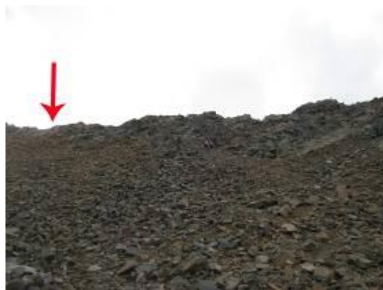
Фото 30. Седловина пер. Шумак.