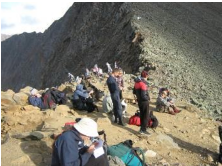
Фото 31. Группа на пер. Шумак.