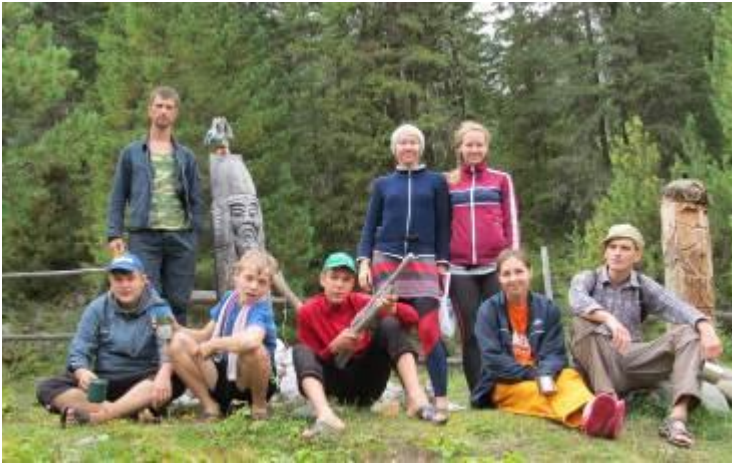
Фото 22. Деревянные фигурки на Шумакских источниках.