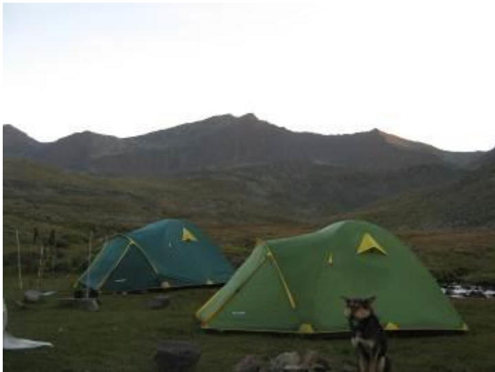
Фото 34. Ночевка под пер. Шумак.