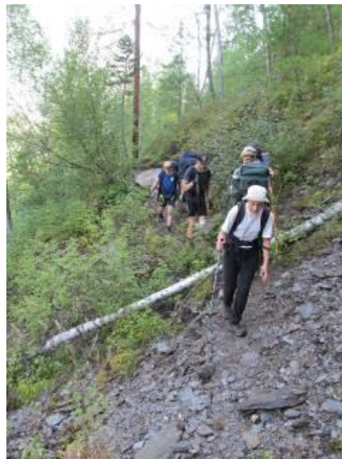
Фото 19. Тропа по берегу р. Шумак.