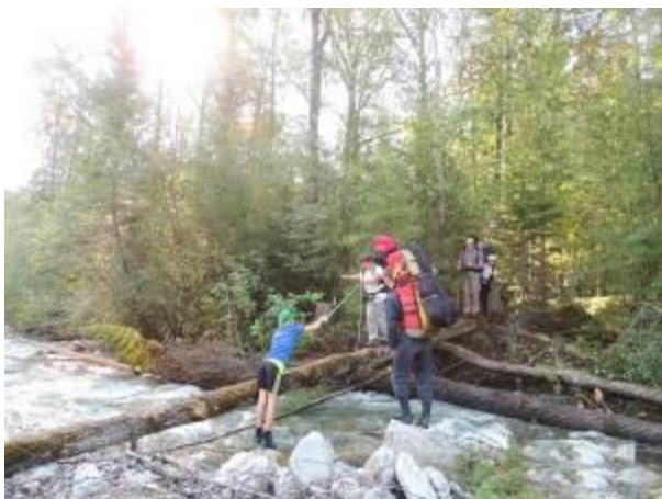
Фото 12. Переправа по бревну через р Ехэ-Гол На переднем плане Ракова И.

Вышли в 8.55. Через 10 мин. подошли к реке Ехэ-Гол. Переправились по бревну со страховкой и взаимостраховкой альпенштоком (фото 12). После переправы тропа начинается прямо по берегу р. Китой. Мы ушли по тропе, которая привела нас к озеру и там закончилась. Пришлось обходить озеро слева без тропы, а затем выходить снова к реке. Река поражает своим зеленым цветом, шириной и скоростью. Тропа хорошо заметна, идет то по берегу (в основном по верху), то отходит от него ближе к хребту (фото 13). Тропу пересекают несколько мелких ручьев. Недалеко от р. Ехэ-Гол есть несколько хороших стоянок, далее тропа идет по верху над прижимами, и стоянок нет в течение 2-2,5ч. После прижимов опять есть хорошие стоянки. На обед встали в 13.00 на песчаном пляже р. Китой, изумительное по красоте место (фото 14). По дороге опять собирали грибы, на обед борщ с грибами. Далее тропа идет то вдоль берега, то уходит ближе к хребту. Прошли 4 довольно больших ручья. Как по расписанию после обеда грозой дождь. Тропа очень скользкая, камни, корни деревьев. Много поваленных деревьев. Встречаются горелые участки леса. После Березового ручья тропа отделяется от Китоя небольшим отрогом, идет по верху, внизу небольшое красивое озерцо. При подходе к реке Билютой тропа выходит к берегу Китоя. Он поражает своей мощью. Здесь очень узкий участок реки, много сливов, мощные валы. На стоянку встали на правом берегу р. Билютой, дров мало.