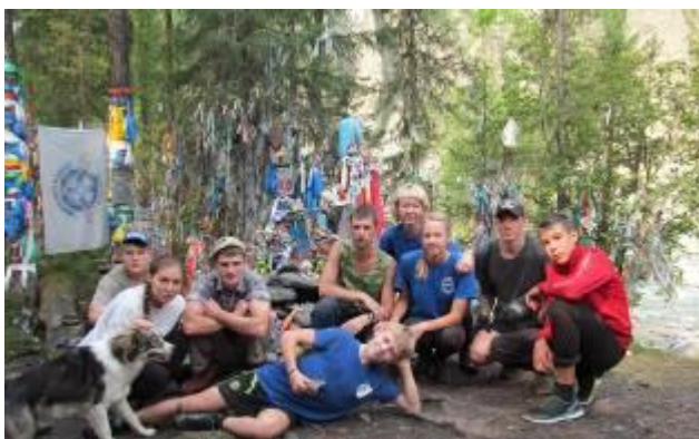
Фото 20. Священные деревья в 6 км. от Шумацких источников.