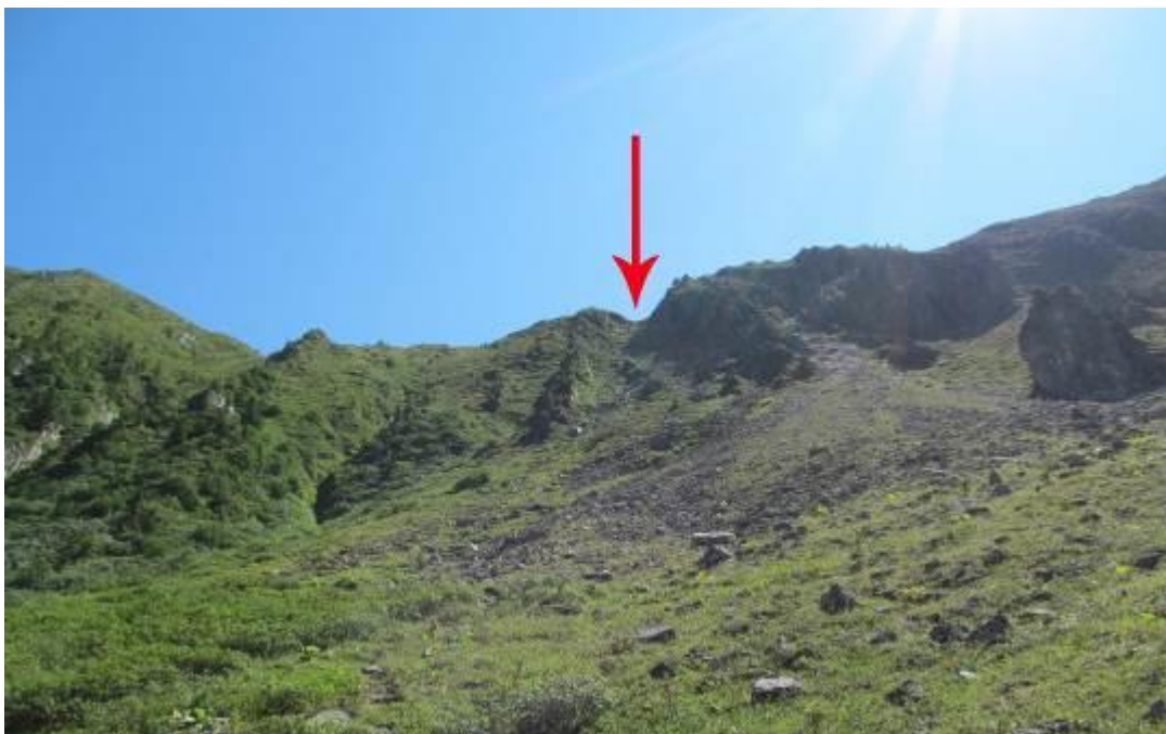
Фото 10. Вид на пер. Аршанский со стороны р. Федюшкиной.