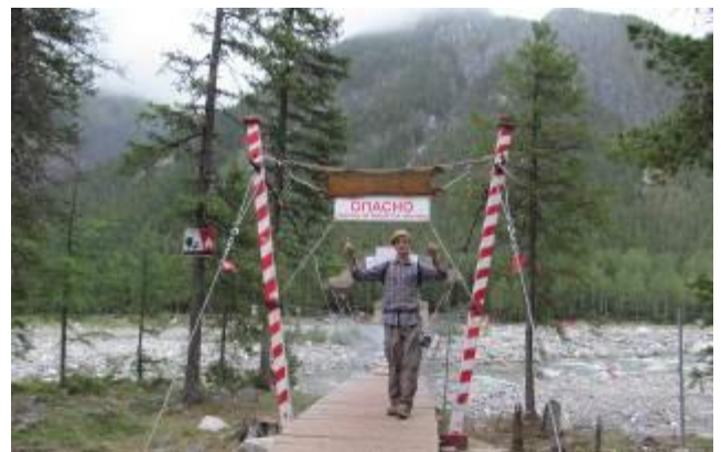
Фото 25. Мост через Шумака.