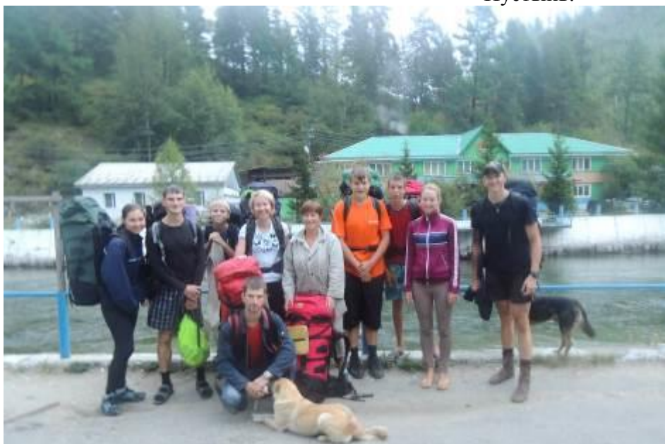
Фото 36. Курорт Нилова Пустынь. Окончание маршрута.