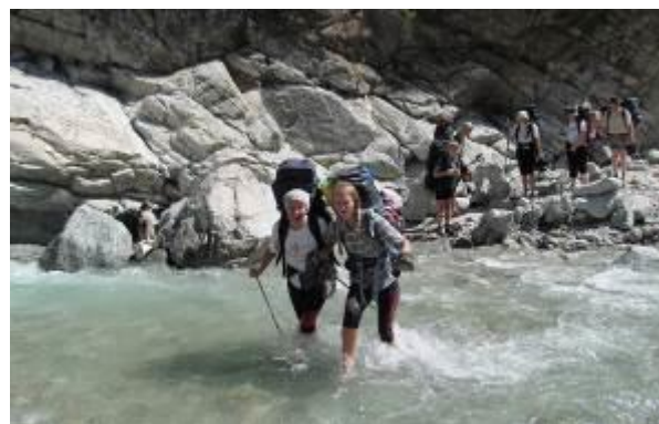
Фото 3. Переправа через р. Кынгарга по бревну. Фото 4. Переправа через р. Кынгарга вброд.