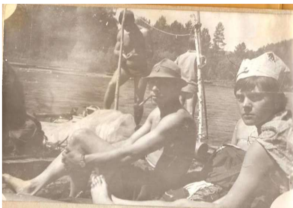
Мана – 1969 год