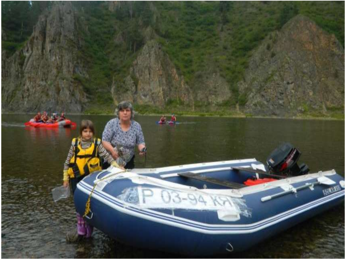
Мана – 2012 год