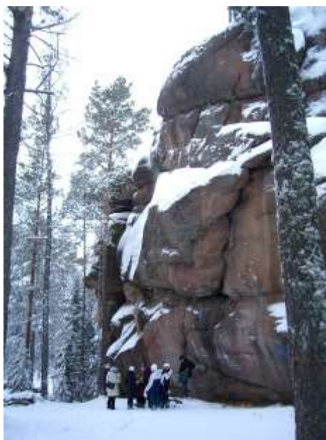
В заповеднике «Столбы» зимой