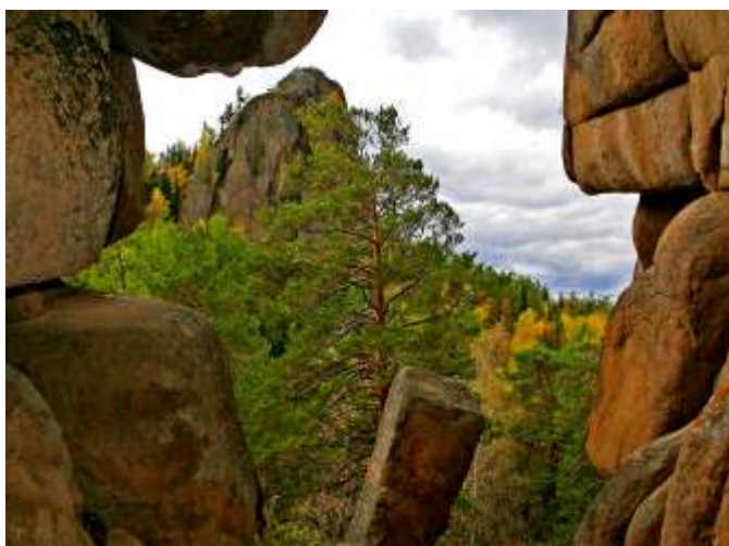
Вид на скалу «Второй столб» с «Первого столба» (ход «Обелиск»)