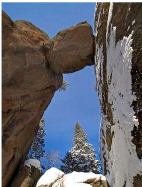
Скала «Львиные ворота»