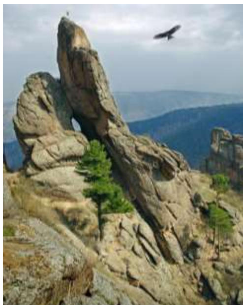
Скальный массив «Такмак», Скала «Большой Беркут»