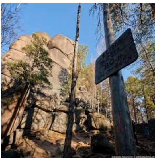
Скала «Первый столб»