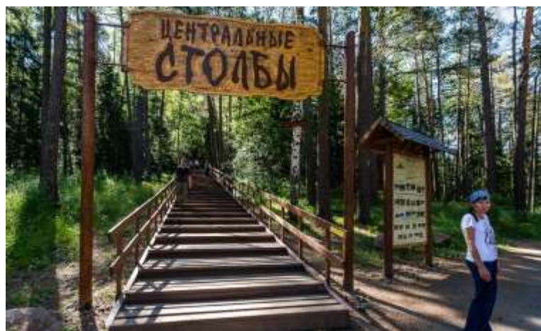
Вход в туристско-экскурсионный район заповедника